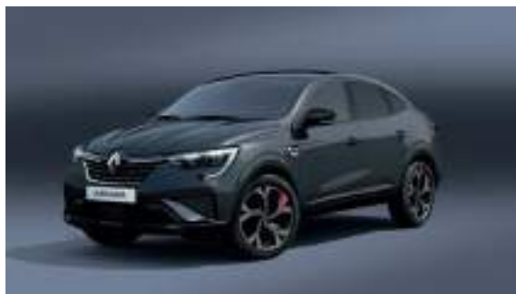
Gris Métal (PM)