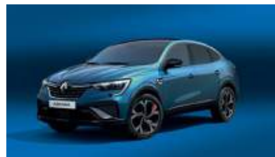
Bleu Zanzibar (PM)

OV : opaque vernis. PM : peinture métallisée. photos non contractuelles. * non disponible en version R.S. line ** disponible uniquement en version R.S. line