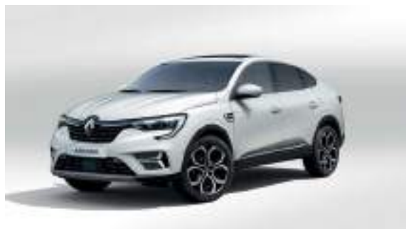
Blanc Opaque* (OV)