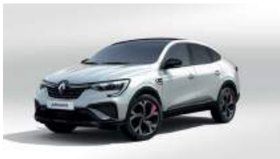
Blanc Perle (PM)