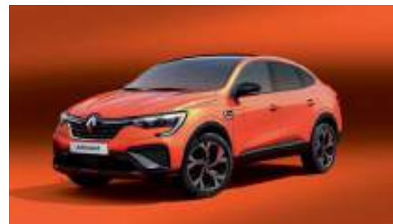
Orange Valencia** (PM)

OV : opaque vernis. PM : peinture métallisée. photos non contractuelles. * non disponible en version R.S. line ** disponible uniquement en version R.S. line