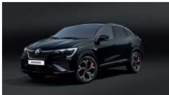
Noir Métal (PM)