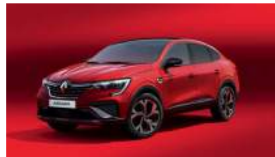
Rouge Flamme (PM)